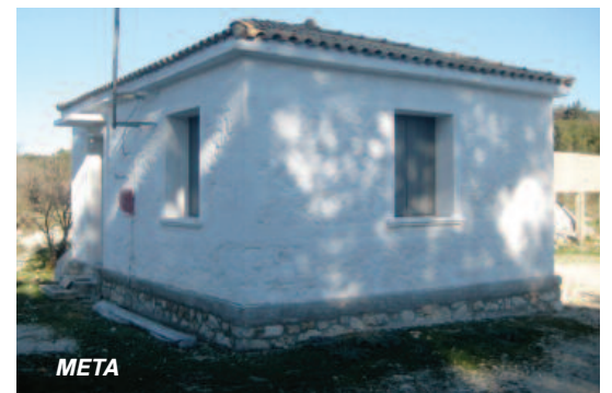
Πρώην Κοινοτικό Γραφείο Αλεξάνδρου