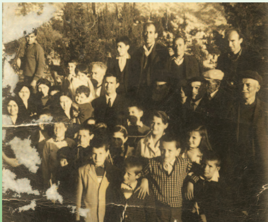
Κολυβιάτες το 1968