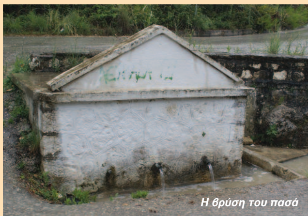
Η βρύση του πασά

περιοχή Μαγγανά σημειώνει: «Κατά τον Μεσαίωνα Νεώρια ή Ταρσανάδες μνημονεύονται πολλά στη Λευκάδα. Υπήρχαν στην Χώρα, στη Λυγιά, στον Εγκλιμενό, που διατηρήθηκαν ως τα σήμερα, ιδιαίτερα της πόλης και του Βλυχού. Για την προστασία τους ο στόλος ελιμενίζονταν στα γύρω πριγκηπονήσια και το καλοκαίρι υδρεύονταν από το νερό του Πασά-Μαγγανά. Αυτή την